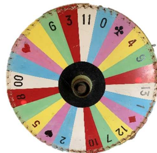
Ancienne roue de kermesse de Mesnil