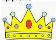
Couronne des rois