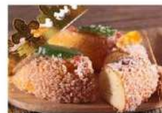
Pâtisserie Brioche des rois