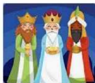
Coloriage des rois mages