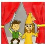
Atelier théâtre sur l'Épiphanie