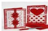
Cartes de Voeux

12 H : Repas tiré du sac au logis rue des fossés (face à la place de l'église)