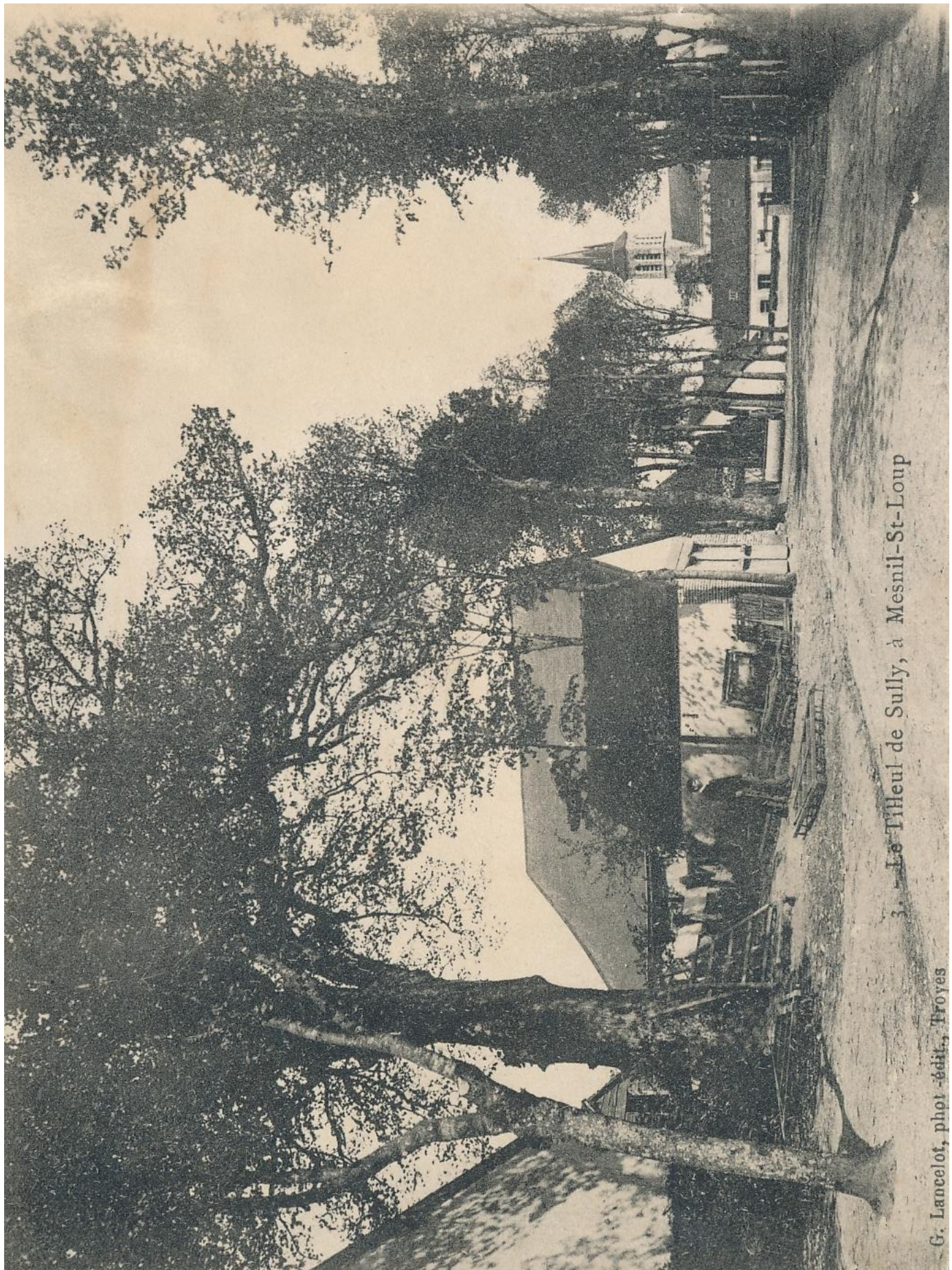
3. - Le Tilleul de Sully, à Mésnil-St-Loup